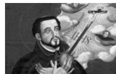
聖フランシスコ・ザヴィエル肖像画