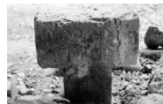
原のキリシタン墓碑

岡藩・中川家の太祖・清秀公は、同じ隠れキリシタンの里として知られる大阪府茨木市の出身です。この度は、茨木市との歴史文化姉妹都市交流5周年を記念し、大正9年に発見された『聖フランシスコ・ザヴィエル像』(レプリカ)とザヴィエルの遺体の一部(本物)を特別展示します。