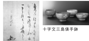
高山等伯書状(お灸の文)