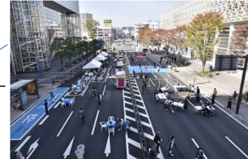
iichiko 総合文化センター