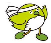
大分県応援団“鳥”めじろん

県のマスコットキャラクターとして県民に定着している「めじろん」をベースに、本大会用にアレンジしました。