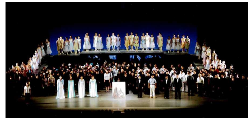
フィナーレステージ(イメージ)