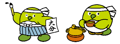
文化祭バージョン