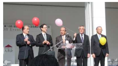
11.12 キックオフセレモニーの様子